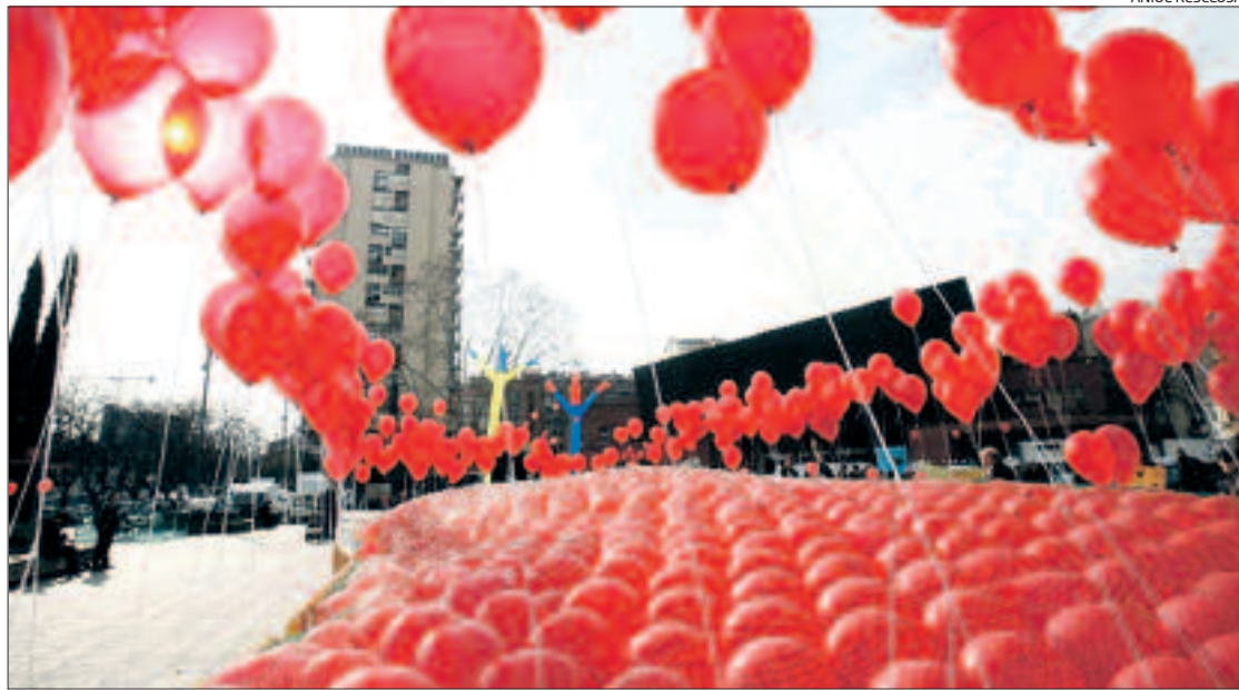
La cercavila del festival va arribar fins a la plaça de Salvador Espriu, on hi va haver una festa.